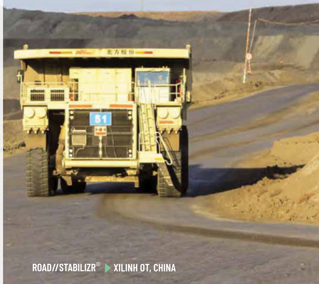
ROAD//STABILIZR® ► XILINH OT, CHINA

Mediante una aplicación única de ROAD//STABILIZR®, puede obtenerse una reducción significativa de costos mediante el uso de materiales de construcción más baratos, reducciones a largo plazo en los costos de mantenimiento y una amplia reducción en la resistencia a la rodadura. Las reducciones en el polvo también son un efecto secundario agradable.